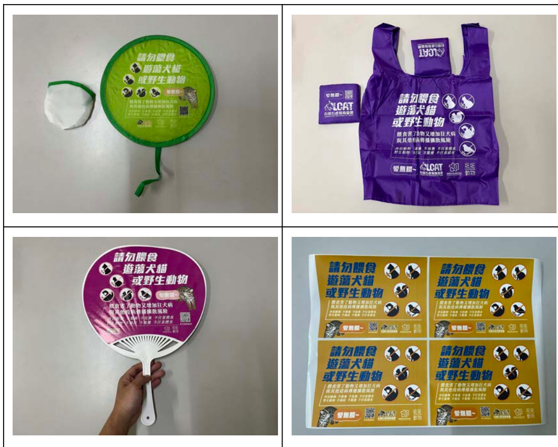
圖5、為了避免雞舍損失、有效保育石虎不要餵食犬貓文宣

除了包含石虎等野生動物可能造成農友家禽的損失外，流浪犬隻也是危害之一，並且帶來更高的風險，因為犬隻攻擊的習性，遭到流浪犬入侵的禽舍，往往造成全數家禽損失，以及農友的心痛與憤怒。然而，以往在夜間發生的禽舍入侵事件中，沒有實際看到入侵動物，農友常常誤以為家禽損失都是石虎造成，因此對石虎有強烈的負面印象。有鑑於此，在進行本計畫社區石虎保育推廣之時，使用本計畫的紅外線自動相機的紀錄到的流浪犬危害影片及照片資料，向農友說明危害並不一定是石虎造成，以減少居民對石虎的敵意，同時輔以文宣(圖5)加強認知與提醒功能，向社區居民推廣不要餵食流浪犬貓，以避免流浪犬貓聚集，可能造成的更大危害。在多方的努力中，降低農友損失和對石虎的負面觀感，進而願意與石虎和平共存。