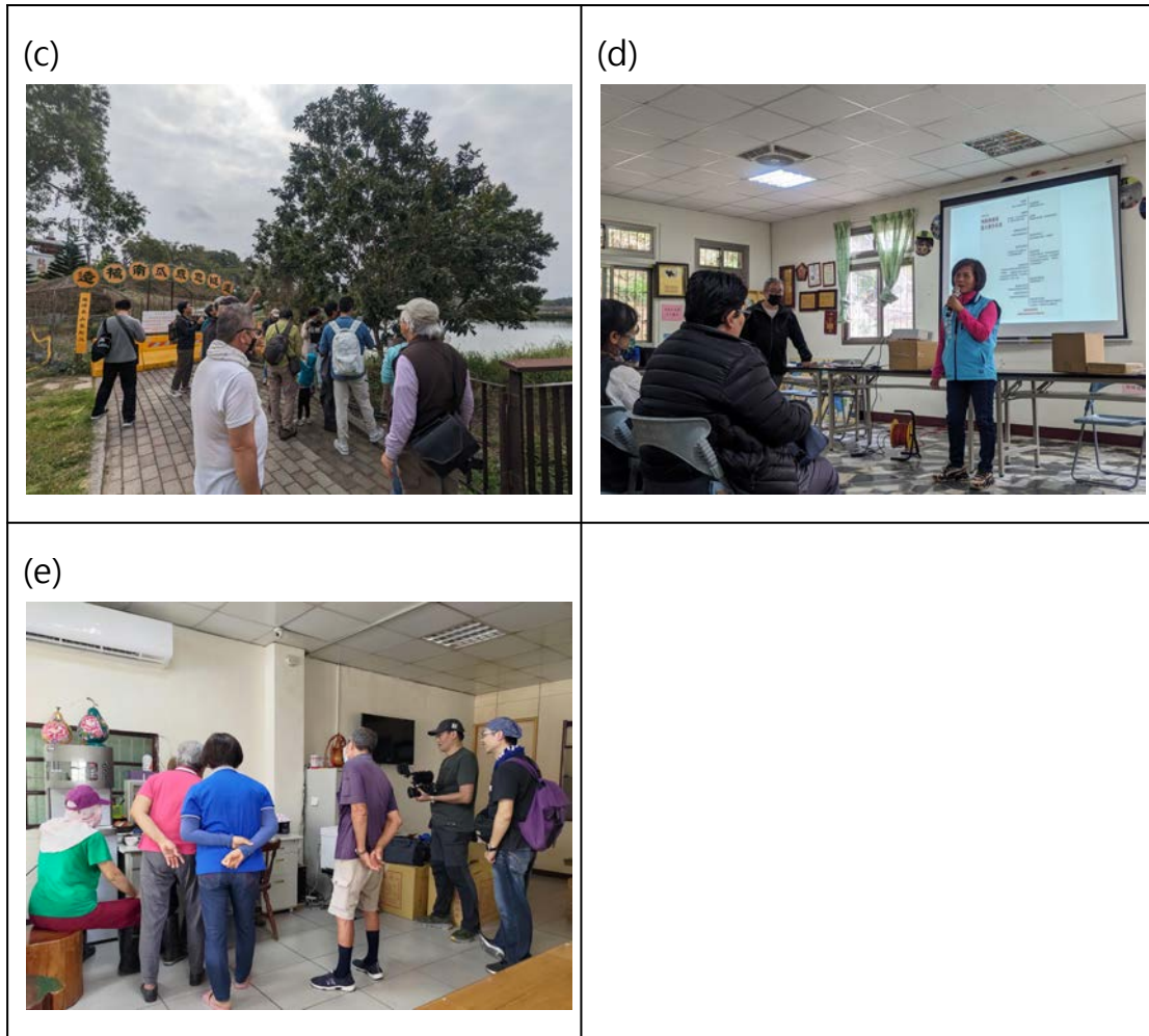
圖3、造橋鄉龍昇社區(a)與馬頭山自然人文協會交流(b)龍昇村長分享石虎保育行動(c)龍昇社區生態導覽(d)龍昇村長分享石虎與棲地保育工作。(e)龍昇社區紀錄片拍攝過程