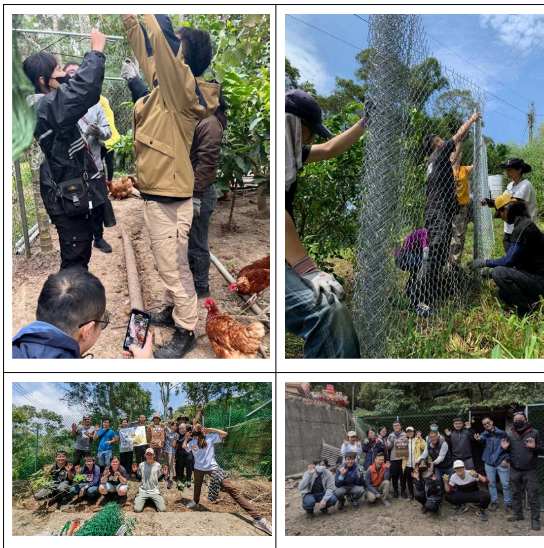
圖1、雞舍改善工作以及完工合照