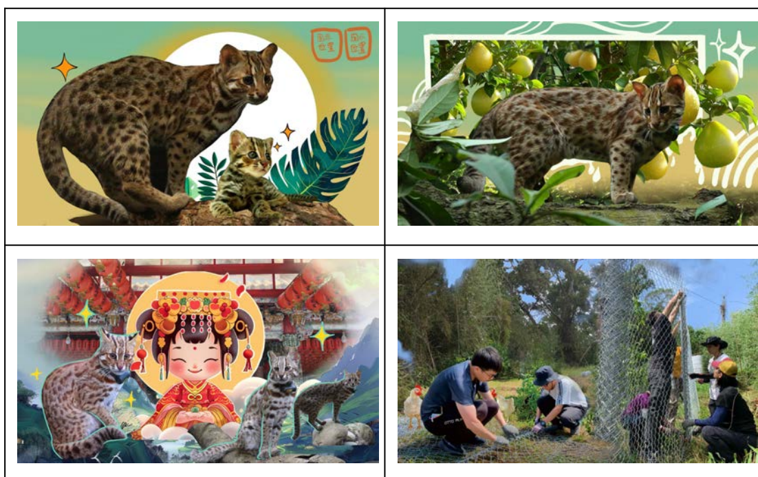
圖4、西湖鄉三湖社區牆面彩繪設計

現階段三湖彩繪牆面工作已達約約三分之二，完成初步圖面設計規劃(圖3)，但由於本計畫於6月底結束，並且經費已用盡，後續將利用自籌經費，並於今(2024)年底前完成彩繪牆面工作。