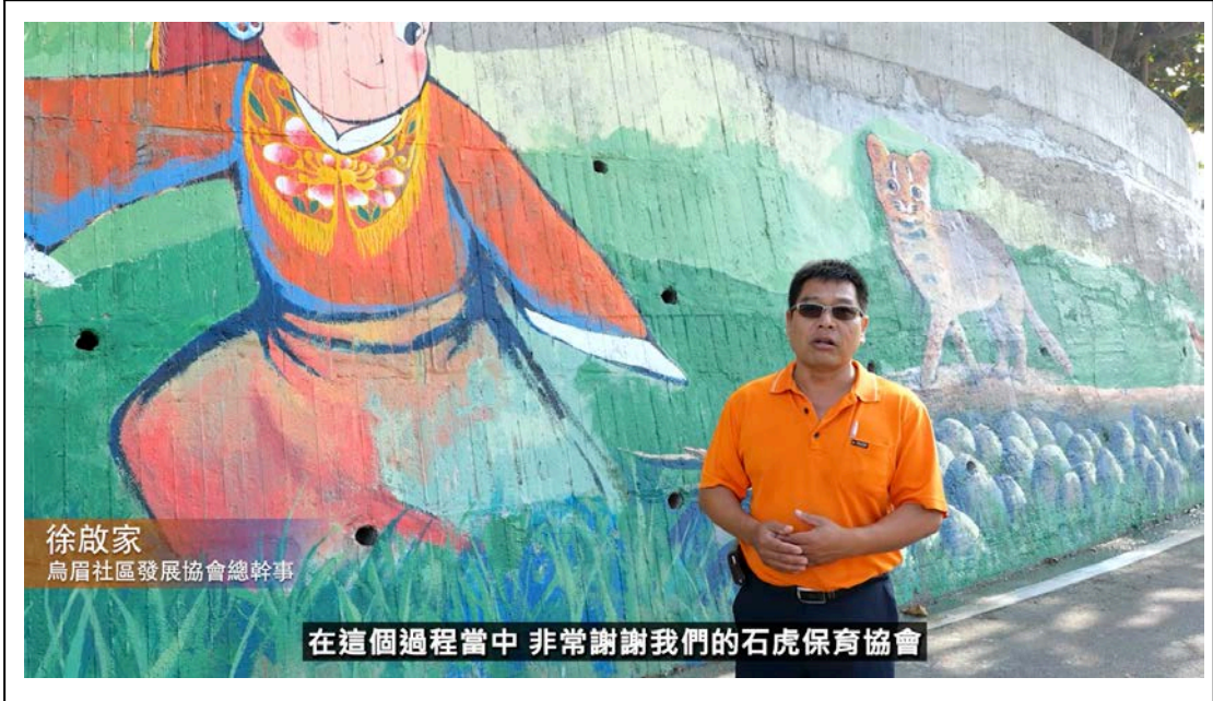
圖2、通霄鎮烏眉社區石虎與媽祖彩繪牆面、繪製過程以及紀錄片